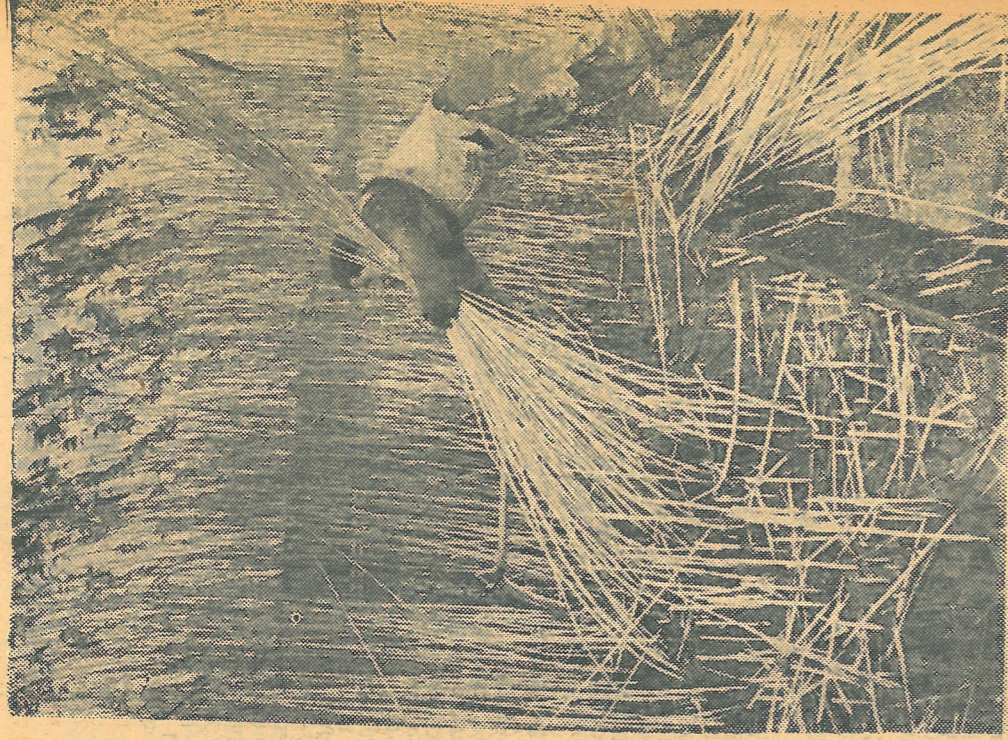
A fagy beállta előtt megkezdtek a nád aratását a Balatonj Nádasgazdaság dolgozói. Balassa Ferenc csónakból vágja a nádat a tév-fülöpi parton. Itt 130 000—140 000 kévét aratnak le évente.