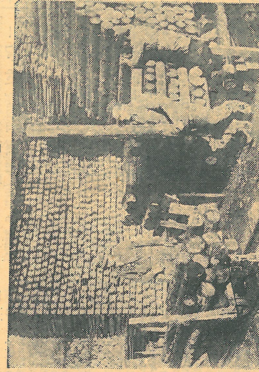
Az új gép — régi rendet talált itt. Erről a fatelepről példát vehetnének másutt is. Olyan szép rendben sorakoznak a száldeszák és egyéb bányafák, hogy egy-kettőre elő tudják készíteni a bányából kért különböző méretű bányafákat.