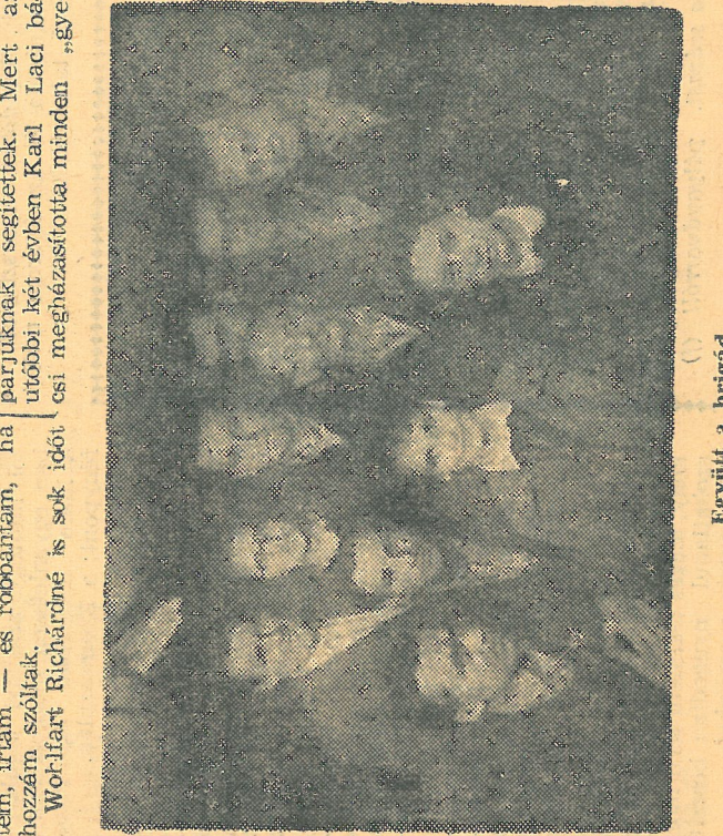
Együtt a brigád.