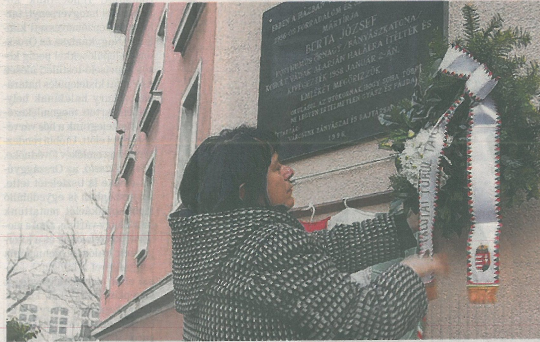
Koszorúkkal és mécsesekkel emlékeztek a fiatalon kivégzett bányászkatonára a Szent Imre utcában