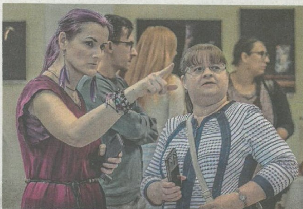
Az Objektív Fotóklub tagjainak fényképei is láthatóak