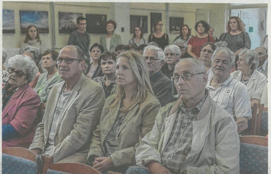
A Várpalotai Napok rendezvénytársorozat részeként nyílt kiállításra sokan kíváncsiak voltak