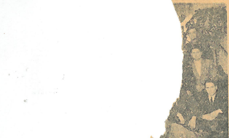
...kezelői tanfolyam, amely a kóros képességet.