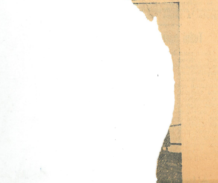
...ése véget magasztaltják.