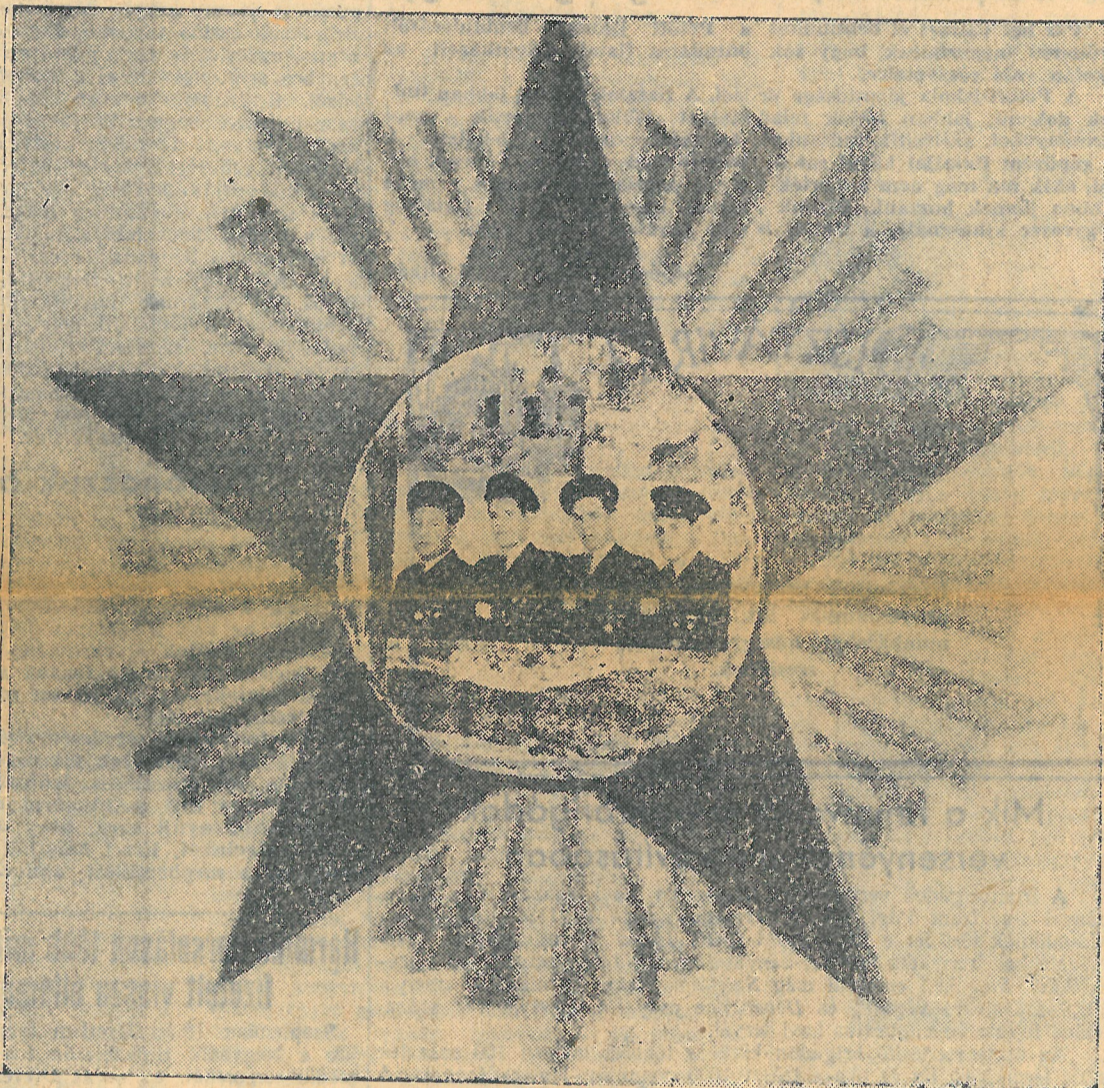
A munka nálunk a becsület és a dicsőség dolga lett

növekszik a munkafegyelm-bontó. Csak adminisztratív intézkedéssel ezt megátolni nem lehet. A párt, DISZ és a szakszervezet, valamint az üzemvezetőség együttes munkájára van szükség ahhoz, hogy a munkafegyelmet helyreállítsák és természetüket állandóan 100 százalék fölött tartásuk.