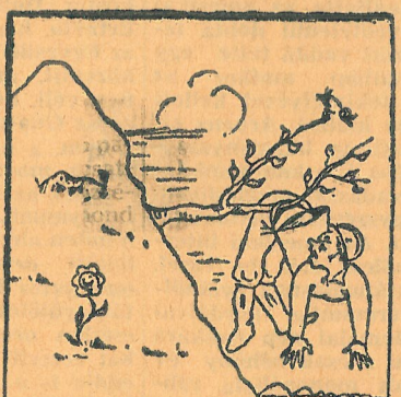
3. Ősi-akna 94,5 százalék