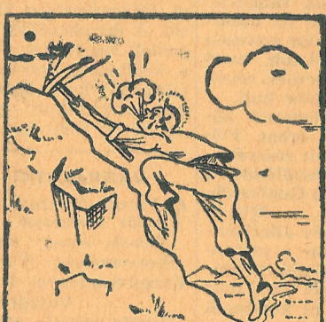
2. Ferenc-akna 95 százalék