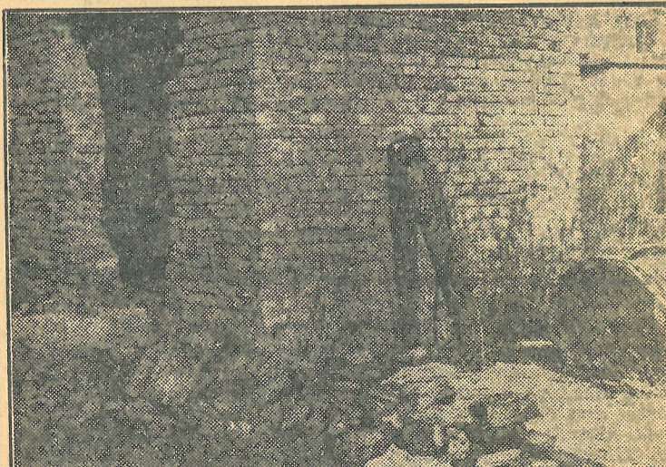
Ez az a buvárszivattyú, amire olyan sokszor felhívtuk vezetőink figyelmét, de még mindig kint hever a hóban, nem jut el rendeltetési helyére.