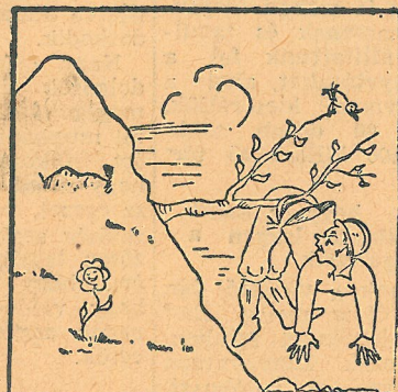
3. Ósi-mező 102,4 százalék