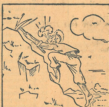
2. Ferenc-mező 106,5 százalék