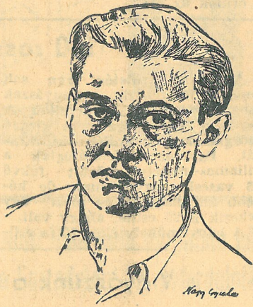
és beralapja is kitűnő.

Mióta a Beszáló-aknának vezetője Fischer elvtárs, azóta nem múlt el egy hónap sem tereljesítés nélkül. Azonban nemcsak, hogy a tervelt teljesítette, az önköltséget is csökkentette, a szén előállítás költséget több mint öt forinttal lenyomta, minőségi tervét 105 százalégra teljesítette, ja felhasználása