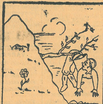
Hidas-bánya 95 százalék