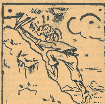
Cser-bánya 99,6 százalék