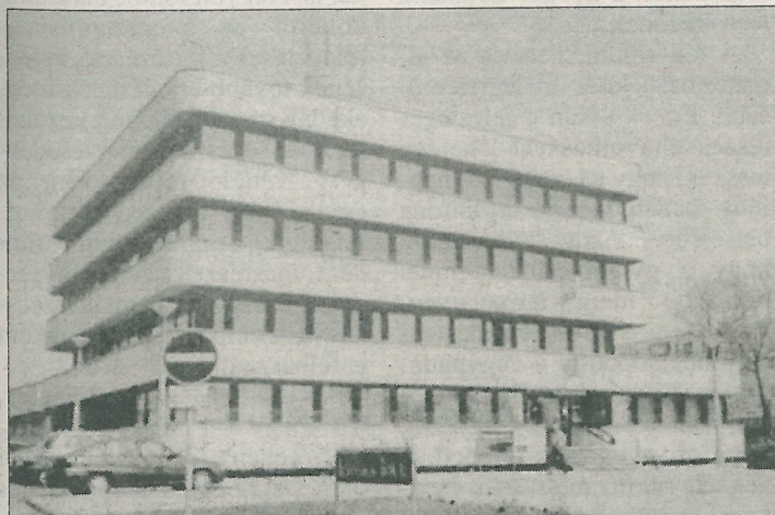
Hitelbank épült a régi bányaigazgatóság helyén