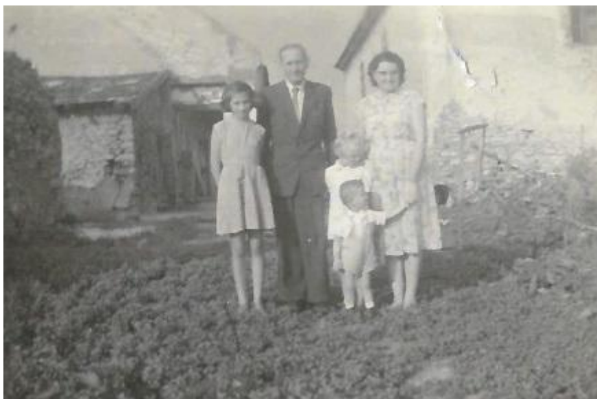
Inota, református parókia, 1960

1954-ben kineveztek Inotára lelkésznek. Az állást egy év után sikerült elfoglalni, addig a parókián lakott a párttitkár. A kommunisták számos alkalommal költöztették társbérletbe funkcionáriusaikat egyházi tulajdonú épületekbe a miheztartás végett. A feleségem nagyon félt tőle, hiszen akkor már két kisgyerekünk volt és amikor a párttitkár berúgott, a szemük láttára pisztollyal hadonászott és fenyegetőzött. Gondolják el, milyen volt ilyen körülmények között élni, bízni, hogy egyszer csak szebb és jobb lesz és Isten országa el fog jönni.