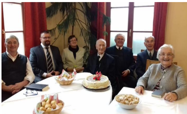
Székesfehérvári nyugdíjas lelkészek Biblia órája, 2018

Ha összegeznem kell ezt a gyorsan tovatűnt 100 évet, azt mondanám, hogy az Úr nehéz időkben komoly próbatételek elé állított, de ugyanakkor mindvégig velem volt. Jó és hűséges társat adott nekem, akivel sokáig tudtunk dolgozni Isten ügyéért. Ahhoz, hogy lelkészi pályára mentem, kellett édesanyám buzgó imádsága, aki 2 világháborún át imádkozott, előbb édesapámért, azután fiaiért. Én életem során hol a háború fenyegető rémével, néha ígéretekkel, karrier lehetőségek csábításával, végül pedig hol burkolt vagy nyílt fenyegetésekkel találkoztam, de kiálltam a próbát. A gonoszt és a kísértéseket el kell kerülni, hitre támaszkodva, naponta őszintén imádkozva, társainkkal, szeretteinkkel együtt.