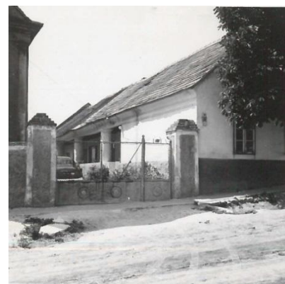
A finn ex-pénzügyminiszter Volvója az inotai parókián, 1964