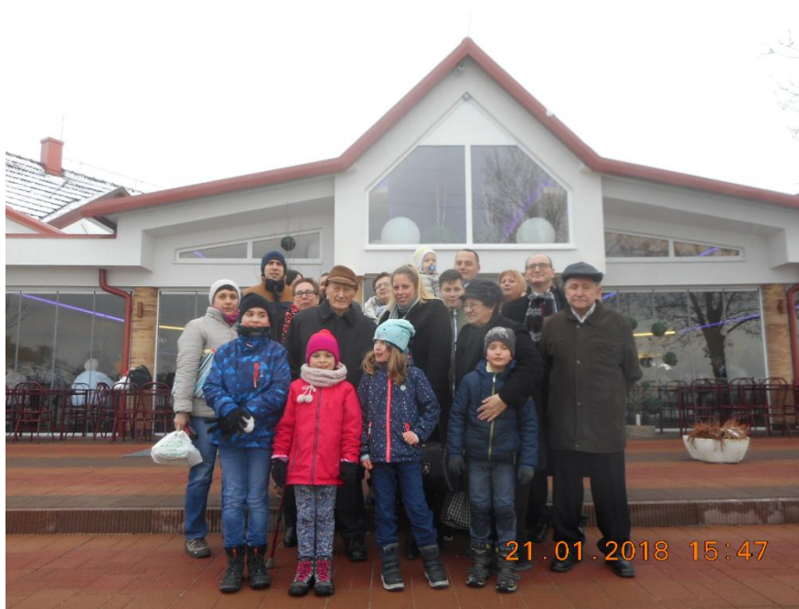
A 99-éves születésnap ünneplése Sukorón, 2018