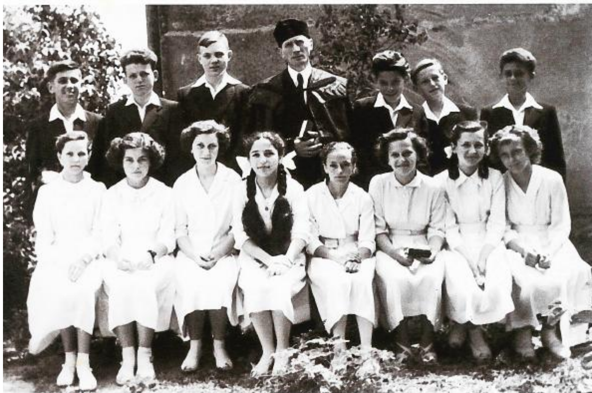
Konfirmáció 1960-as évek, Inota

Eleinte sokan jártak hittanra is. Sikerült megígértetnem a református családdal, hogy konfirmálni fog a gyermek, követi a család hagyományait. De volt úgy, hogy a párttitkár (ez már egy másik) utánam lépett be az ajtón és feltette a kérdést, asszonyom, ezek szerint azt akarja, hogy holnap a férje az S2-re kerüljön? Ez egy hírhedten balesetveszélyes bánya volt, hirtelen nem is tudom megmondani, hány derék bányász vesztette életét, amíg ott szolgáltam. Így fenyegették, kényszerítették a falut arra, hogy sorvadjon a hitélet. S aki fiatalon nem ismerkedik meg Isten igéjével, azt később már nehezebb az Ő tanításához hajlítani. A gyerekeket pedig az iskolában hétfőnként kérdezték, "Ki volt vasárnap templomban? Álljon föl!" Ez még a '70-es években is megtörtént.