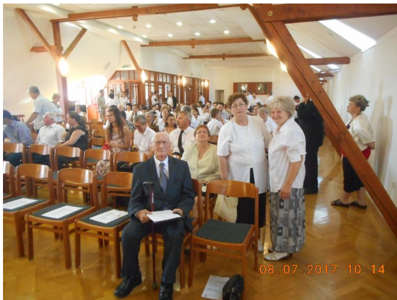
Gránitdiploma, 2017, Pápa

A finn nyelvet nem hagytam abba, igyekeztem világi és teológiai vonatkozású könyveket is olvasni, amint olyan szintre jutottam. Amikor a Hét testvér került a kezembe - a finnek nemzeti könyve - kissé a magunk életét láttam leírva, egy család a tanyán, ahogy a megélhetésért küzd, saját démonaival, emberi esendőségével birkózik, majd a tanulás és az evangélium segítségével egyre magasabbra, emberileg egyre többre jut.