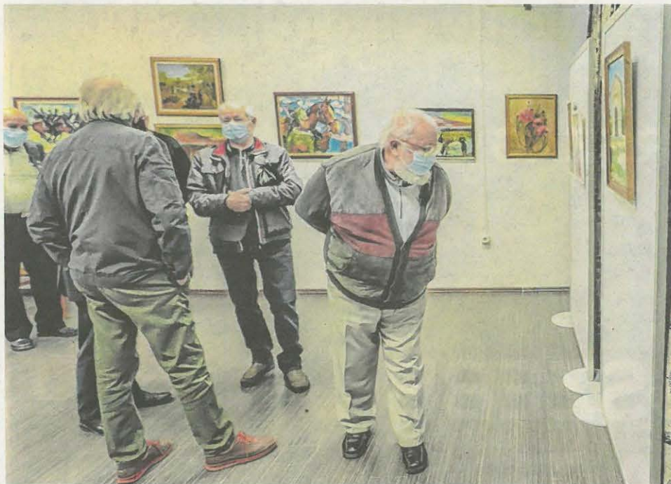
Helyi festőművészek is ellátogattak a könyvtárban nyílt rendhagyó kiállításra