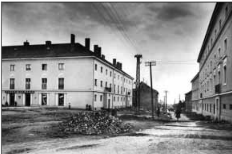
Kossuth utca eleje, 1953