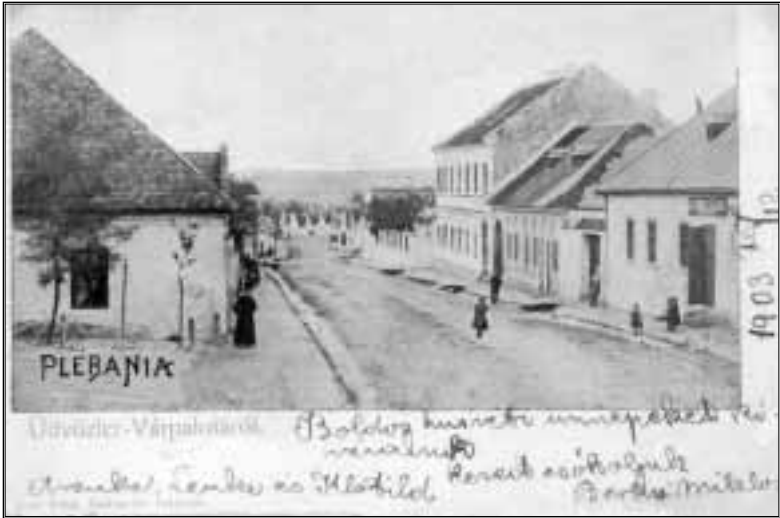
Kossuth utca a plébániával, 1903