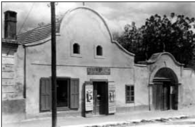
Bölcsek háza a Kossuth utcában, 1935