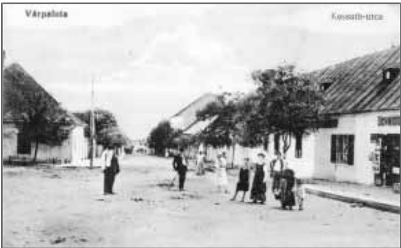
Kossuth utca, 1910