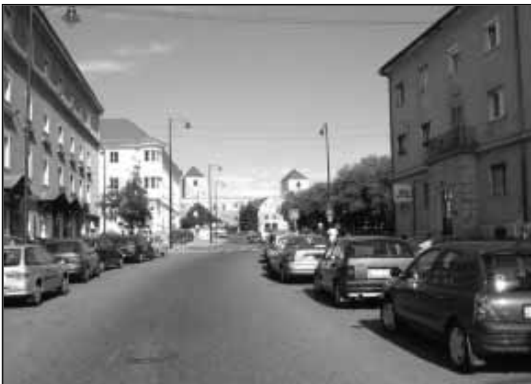
Kossuth utca felső vége, 2004