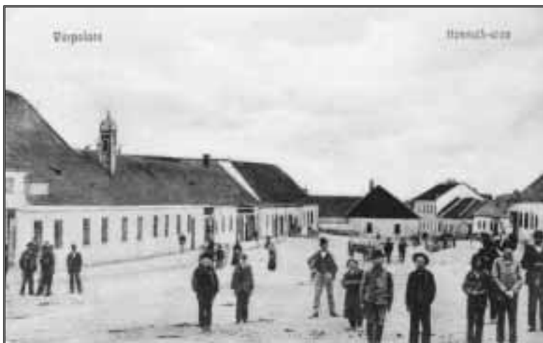
Kossuth utca a Fő tértől, 1914