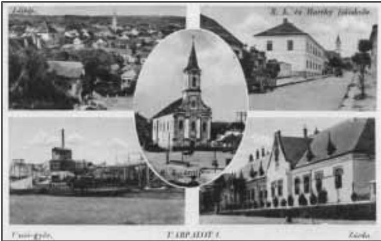
Mozaik képeslap, jobb felső kép: a Kossuth utca eleje a római kat. és Horthy fiúiskolával, 1942