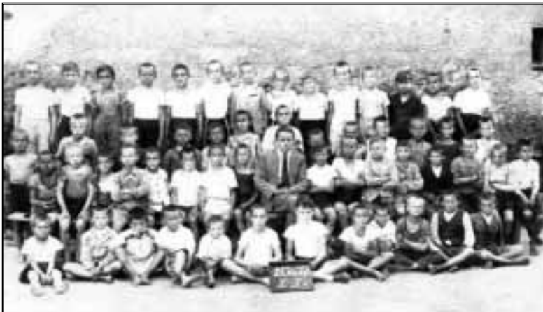
1936-37 év 3-4 osztály csoportkép