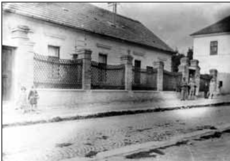
A posta épülete a Kossuth utcában, 1937