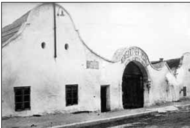
Baumgartner Mihály háza a Kossuth utcában, 1920–21