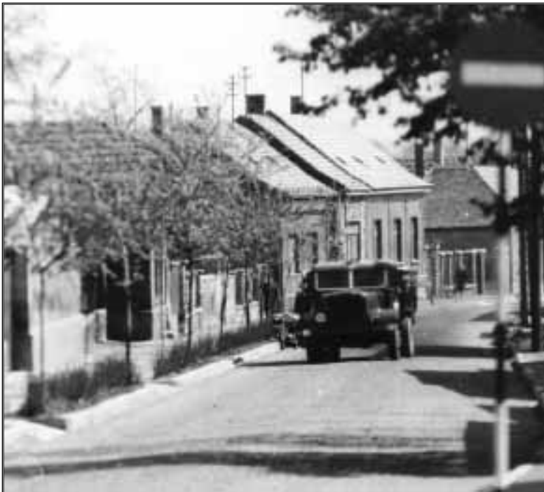
Kossuth utca, 1959