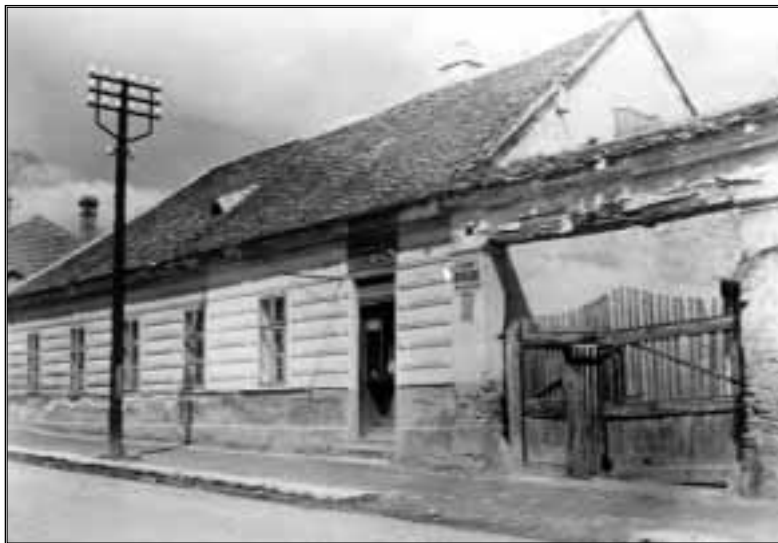
A Kramaszta-ház a Kossuth utcában, 1935