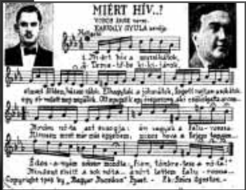
Karvaly Gyula zeneszerző