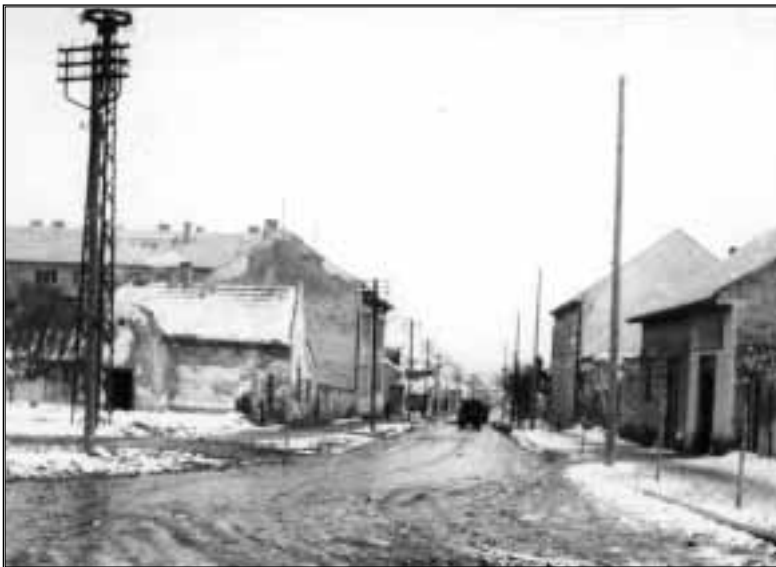
A Kossuth utca felső vége, 1948