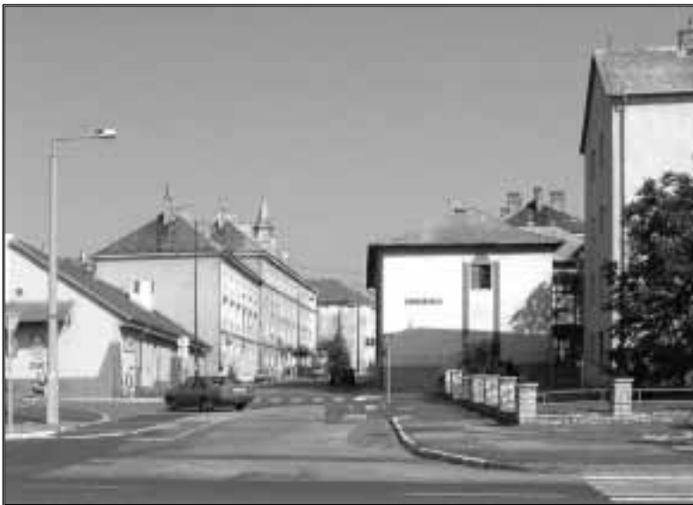
Kossuth utca felső vége a Zeneiskola épületével, 2004