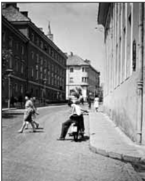
Kossuth utca eleje, 1959