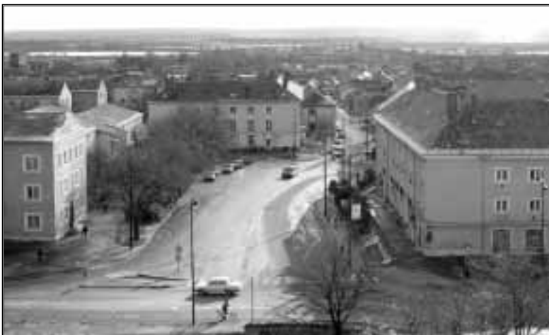
Látkép a Kossuth utcáról a Főtér irányából, 2004