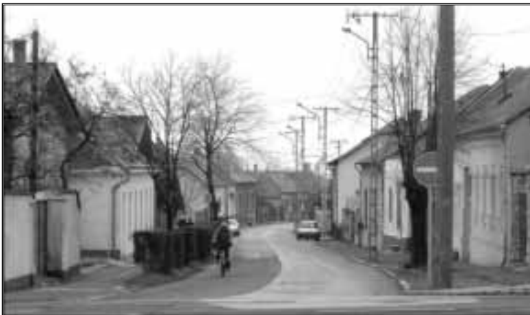
Kossuth utca alsó része, 2004