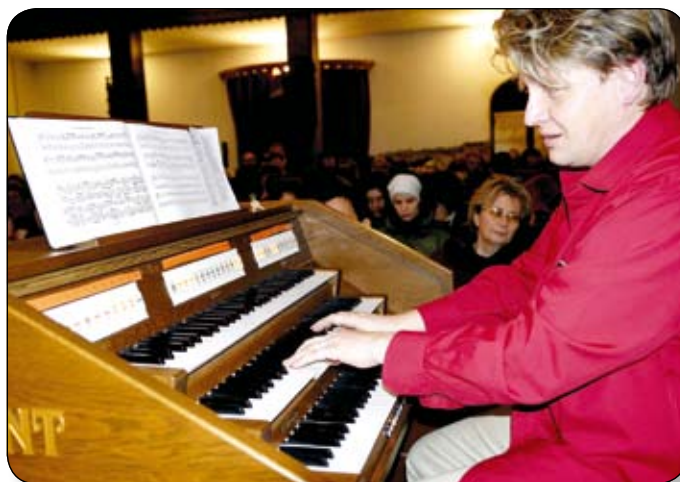
NAGY SIKERŰ KONCERTET ADOTT KARÁCSONYKOR VARNUS XAVÉR ORGONAMŰVÉSZ A SZÍNŰLTIG MEGTELT VÁRPALOTAI REFORMÁTUS TEMPLOMBAN. A BELÉPŐDÍJ HELYETT FELAJÁNLOTT ADOMÁNYOKAT A TEMPLOM FELÚJÍTÁSÁRA FORDÍTJÁK

Várpalota, Thuri György tér 1. Istentisztelet: vasárnaponként gyermek-istentisztelet 9 órakor, úrvacsorai istentisztelet 10 órakor. Hónap utolsó vasárnapján családi istentisztelet 10 órakor.