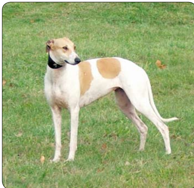
A MAGYAR AGÁR HÚSÉGES, KITARTÓ, IGÉNYTELEN, KEDVESKEDŐ

A mai magyar agár kialakításában szerepe volt még az Angliából a XIX. században importált an-