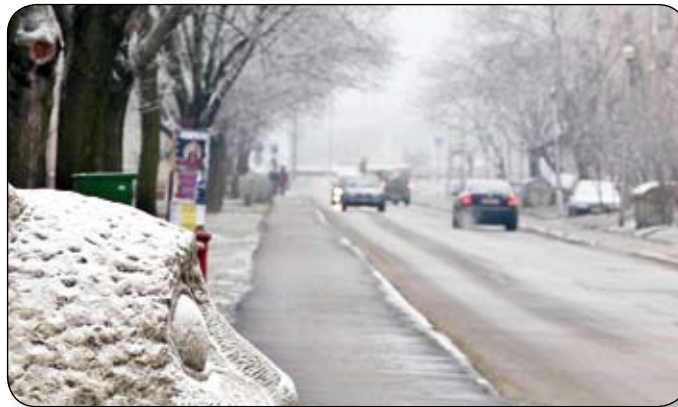
AZ ÖNKORMÁNYZAT SIKERREL PÁLYÁZOTT A TÉSI-DOMB REHABILITÁCIÓJÁÉRT

A pályázat célja a hátrányokkal küzdő iskoláskorú gyermekek és azok családjai integrációs esélyeinek növelése, iskolán kívüli feladataik ellátásának elősegítése, illetve segítségnyújtás az iskolai megfelelés terén. A megnyert 100%-os támogatású pályázat eredményeképpen 20 millió forint áll rendelkezésre olyan, nem közvetlenül iskolai tevékenységekre vonatkozó elfoglaltságok megszervezésére, mint a szabadidő hasznos eltöltése, valamint a személyiségfejlesztésre, pályáorientációra vonatkozó programok. A folyamatba a szülők is bevonásra kerülnek, többek között a szülői szerep bővítése, konfliktuskezelés fejlesztése területét érintve. A program a tervek szerint ez év