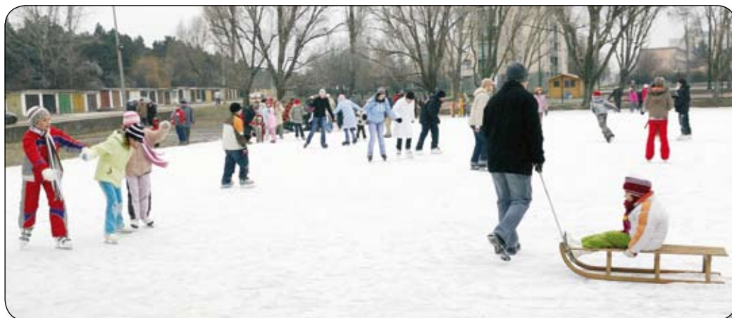
A TÉSI-DOMBI SPORTPÁLYÁK EGYIKÉN MEGFELELŐ MINŐSÉGŰ JÉGPÁLYÁT ALAKÍTOTTAK KI A KORCSOLYÁZÁS SZERELMESEINEK

A péti jégpálya előtti időkben az iskolák udvarán alakítottak ki jégkorcsolyázásra alkalmas pályákat. Ennek mintájára ebben az évben – köszönhetően a kelően hideg hőmérsékletnek – a Közterület-felügye-