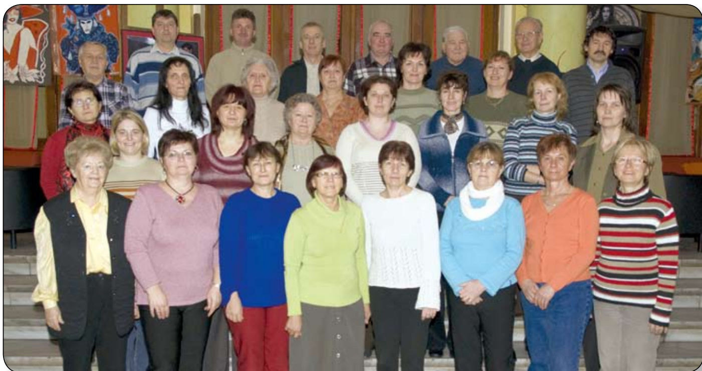
A VÁRPALOTAI BÁNYÁSZ KÓRUS TAGJAI