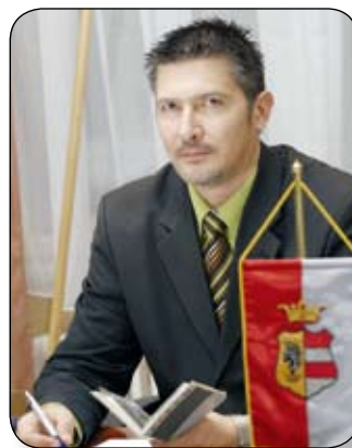
NÉMETH ÁRPÁD POLGÁRMESTER

Egy 60 lakásos társasház panelprogramban való kialakítása mintegy 50 millió forintot jelent. Nekünk, ennek a töredékéből, 13,8 millió forintból sikerült 11 társasháznak a felújítását megvalósítanunk. Amely társasház vállalta a külső szigetelés és színezés renoválását, meghatározott munkák mellett, ott a teljes bekerülés 20%-át az önkormányzat finanszírozta. A vállalkozás eredményességére való tekintettel, a