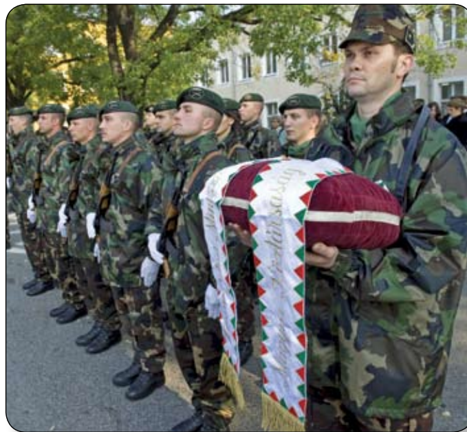
A NEMZETI ÜNNEP ALKALMÁBÓL SZALAGOT KAPOTT A BAKONY HARCKIKÉPZŐ KÖZPONT